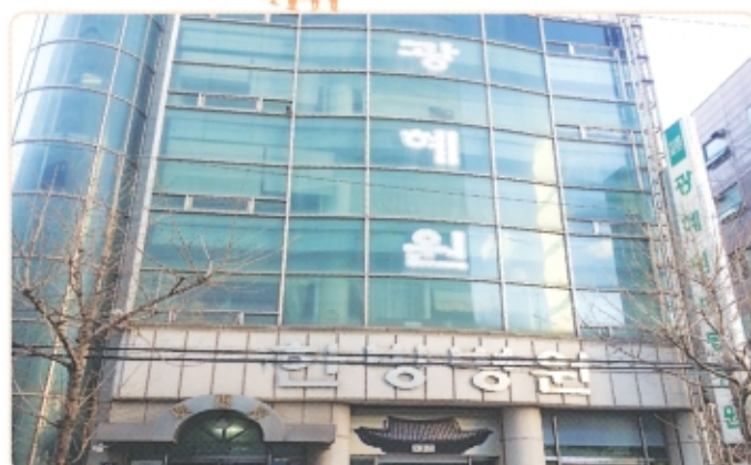
의료법인 광혜원한방병원 (인천광역시 남구 염창로 63) 지역민의 건강을 책임지는 한방병원입니다.