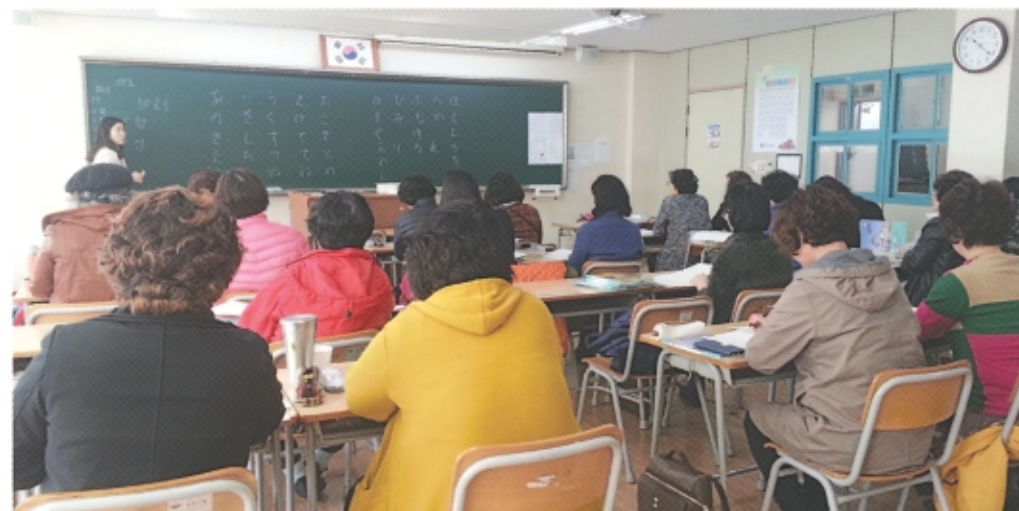
방송통신고 인천여고에서 수업중인

방송통신고등학교(이하 방송고) 현장교육이 있는 일요일 아침 인천여고, 재물포고교가 만학도의 열기로 북적인다. 경제적인 빈곤과 여러 가지 사정으로 공부를 하지 못한 뒤늦게 학업의 한을 풀기 위해 비장한 각오를 한 늦깎이 학생들의 열기가 뜨겁다.