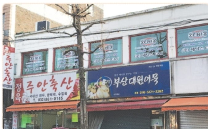
(주)제닉스C&C (인천광역시 남구 갈파로 16(2층)) 투자건설, 부동산개발을 하는 시행업체입니다.