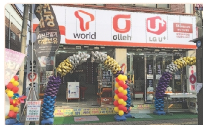
대영정보통신(주안점) (인천광역시 남구 석정로 383-23) 인터넷과 휴대폰을 판매하는 통신 대리점입니다.