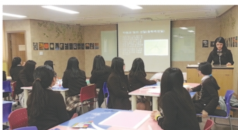
인명여고 ENIS동아리 활동