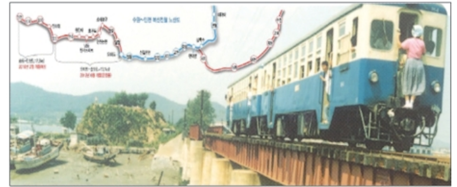
과거 수인선 모습