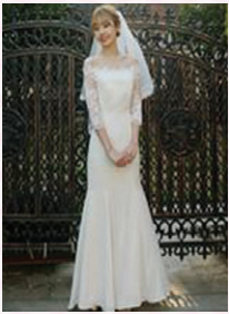
메종드 자스민 의상