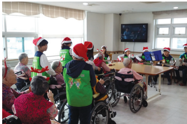
은혜요양원 봉사활동 기타연주 및 안마