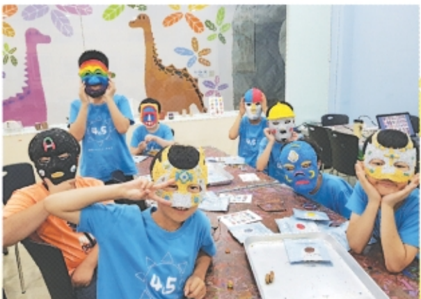
박물관에서 미술체험을 하며 좋아하는 어린이들

저희 인천어린이 박물관은 전시물을 단순히 보기만 하는 박물관이 아닌 손으로 직접 만지고 조작해볼 수 있는 체험식 박물관입니다.