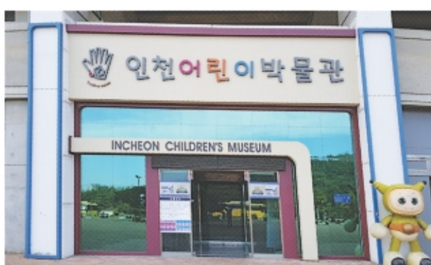
인천 남구 문학경기장 내 위치한 인천어린이박물관

물관입니다. 전시품들과 관련된 다양한 체험전시물을 통해 즐겁게 박물관 관람을 할 수 있습니다.