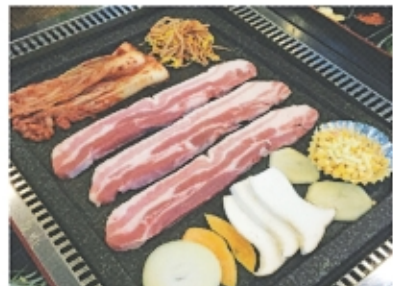
돌판향기의 대표적인 음식인 돌판삼겹살과 북음밥

저희가 어르신들을 위한 후원을 하는 이유도 마찬가지로입니다. 시골에 계시는 저희 할머니 생각이 들어, 우리 가족과 같은 마음으로 조금이나마 그분들을 행복하게 해드리기 위해 노력하고 있습니다.