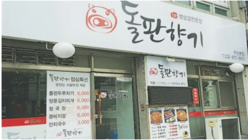
지역주민들과 함께 소통하며 성장해 나가는 음식점 '돌판향기'

Q. '돌판향기'가 미추홀종합사회복지관에서 진행하는 '어르신 생신잔치' 등 여러 가지 후원을 지속적으로