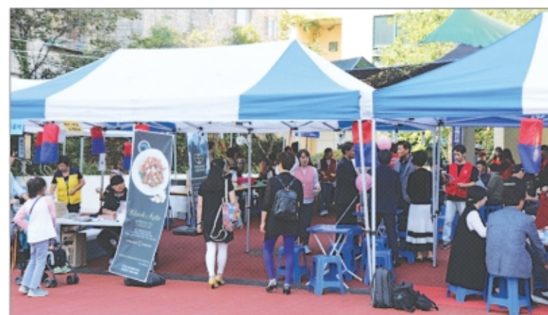
푸라닭과 함께한 미추홀종합사회복지관 '제17회 염전골 한가위 나눔한마당'

많은 분들이 이제는 시그니처가 된 푸라닭의 포장 상자를 특징으로 많이 꼽으실 것 같습니다. 실제로 이 점으로 저희가 유명세를 탄 것도 사실이고요. 그러나 제가 생각하기에 푸라닭의 특징이자 자랑거리는 모든 구성원들의 일관된 마음, '역지사지'인 것 같습니다. 가맹점 사장님들과 같은 관계가 아닌 소중한 인연으로 모시고 그분들의 입장에서 생각하며