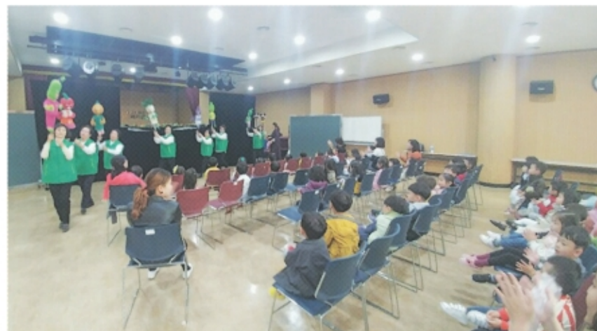
어린이들과 함께하는 인형극

배우 대신 사람이 조종하는 인형이 연극을 하는 것을 인형극이라고 합니다. 인형극은 다양한 나라에서 오랫동안 꾸준히 사랑을 받고 있습니다. 또한 인형이 갖는 주제 전달의 용이함 덕분에 앞으로 도 인형극의 전망을 밝게 하고 있습니다. 특히 어린이를 대상으로 한 여러 교육·예술 활동에서 인형은 효과적인 기능을 합니다. 글이나 말로만 표현하는 것보다 인형을 통한 표현이 주제 전달력에 있어 탁월한 효과를 보여주고 있는 것입니다.