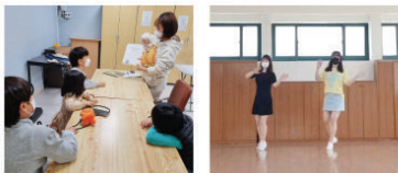
'홀스쿨링' 영어책 여행